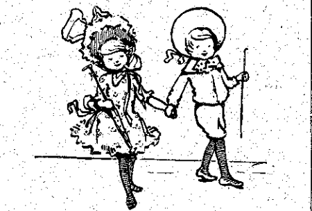
«Πηγαίνουν ἔς τὸ δρόμο...» (Σελ. 380, στ. α')

Φθάνουν στὸ σπίτι τῆς καλῆς κυρίας ἢ μαμμὰ κτυπᾷ τὸ κουδούνι, κ' ἔρχεται καὶ ἀνοίγει ἡ Σταματίνα, ἡ ὑπηρετρία. Τοὺς πηγαίνει στὸ σαλόνι, ποῦ εἶνε μαζεμένες πολλὲς ἄλλες κυρίες καὶ μεγάλα κορίτσια. Ὅλες ἀγκαλιάζουν τὰ δύο μικρὰ καὶ τὰ φιλοῦν. Ὑστερα ὁμοῦ ἀρχίζουν πάλιν νὰ