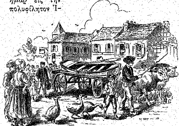
«Ἐπέρασαν Ὀριαμβευτικῶς...» (Σελ. 378, στ. γ')

— Μὴν ἀνησυχῆτε, τὸ δρέπανόν μου γρήγορά θὰ σᾶς ἐλευθερώσῃ... Ἀπὸ ποῦ λοιπὸν ἔρχεσθε, ὦ εὐγενεῖς ξένοι; Ποῦ σᾶς ὀδηγοῦν τὰ πλάνα βήματά σας; Μήπως πηγαινέτε νὰ ἐρωτήσετε τὴν Κίρκην, καθάπερ ὁ πολὺπλαγκτός δῖος Ὀδυσσεύς, τίνι τρόπῳ θὰ ξαναδῆτε τὸ νόστιμον ἡμῶν εἰς τὴν πολυφίλητον Ἴ-