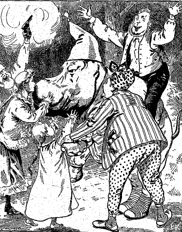
«Ἦλθε τότε ἡ σειρά μου νὰ με φιλήσουν...» (Σελ. 381, στ. β'.)

κείνου τοῦ Τριγωνοκεφάλου Ἐρυθρο-δέρμου. Ἀδύνατον νὰ πιστεύσω ὅτι ἦτο καὶ αὐτὸς ἀνακατωμένος εἰς τὴν ἐπιθε-σιν αὐτῆς τῆς νυκτός. —Τότε γέρο-Τῶμμη μου, πῶς ἐξηγεῖς τὴν παρουσίαν τοῦ μανδρίλλου, τὴν ὥραν τῆς ἐπιθέσεως; Ὁ Αὐγο-στος συνώδευε βέβαια τὸν νέον κύριον του. Καὶ αὐτὸς ὁ νέος τοῦ κύριος, δηλαδὴ ὁ Που-Κόππο-Ουάμπας, ἔμεινε πολὺ φρόνιμα κρυμμένος μέσα στὸ δάσος, ὅταν ἐξαπέστειλε τὴν συμμορίαν τῶν ληστῶν ἐναντίον μας! Αὐτὸ εἶνε, τίποτε ἄλλο! —Τὸ Μέγα Πνεῦμα, ποῦ κρίνει τοὺς ἀνθρώπους, ἄς συγχωρήσῃ τὸν Βασιλεὺς τῶν Χοιρομηρίων διὰ τὴν ἀδίκον κρίσιν του! εἶπε μία θλιμ-μένη φωνὴ ἀπὸ τὸ κατώφλι τῆς φυλλω-τῆς τραπεζαρίας. Καὶ τὸ ὑψηλὸν ἀνάστημα τοῦ Ἀνέμου-ποῦ-Περπατεῖ ἐστρωλῶθη εἰς τὸ πλάσιον τῆς θύρας. Ἀπὸ ποῦ εἶχεν εἰσελθῆ εἰς τὸ πάγκον; Ὅλοι ἔμειναν σὺν ἀπολιθωμένοι ἀπὸ τὴν ἐκπληξίν των ὀλόγυρα στὸ τραπέζι. Τότε ὁ Που-Κόππο-Ουάμπας ἐπροχώρησε μετὰ τὴν συνήθειάν του καὶ ἀπαρά-χον μεγαλοπρέπειαν, πρὸς τὸ μέρος τῆς κυρίας Κορνρόξ, ἠνοῖξε τὰ χεῖρά του καὶ ἄφισε νὰ πέσουν ἀπάνω στὴν ποδιά τῆς τὸ μαργαριταρένιο περιδέραιον, ἢ καρφίτα μετὰ τὰ ζαφείρια καὶ τὰ δακτυλῖδια, ὅλα ὅσα εἶχαν κλαπῆ κατὰ τὴν