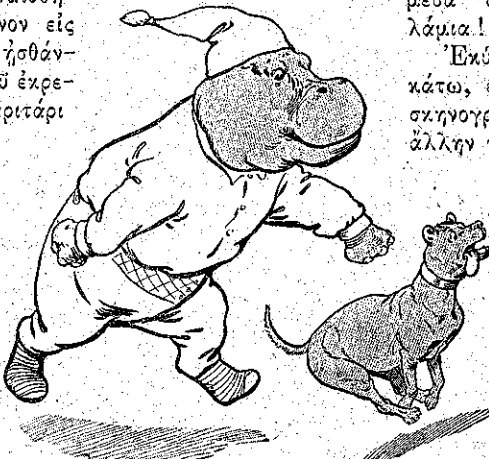
«Ἐμπρὸς καὶ γρήγορα!...» (Σελ. 380, στ. β')